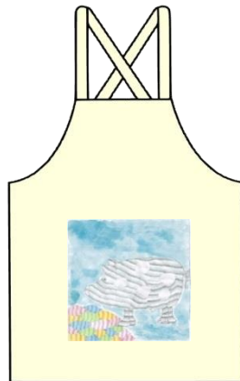
「からいもが大好きな猪豚」