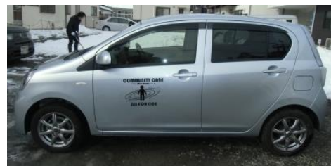
名取市相談支援事業所に 贈った車輛